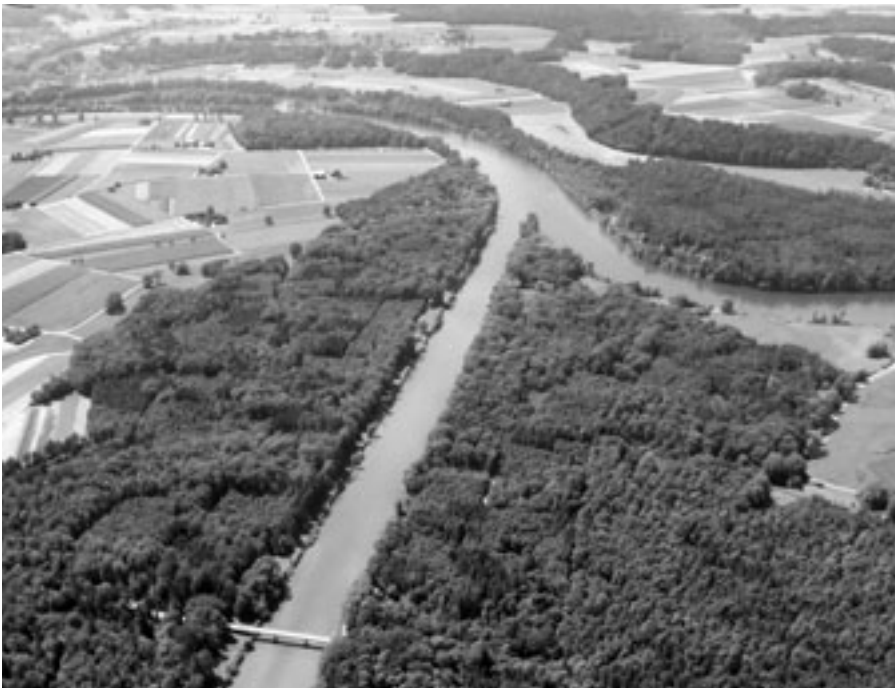
Wälder haben eine hohe Kapazität, Wasser zu speichern (Flugaufnahme der Thur).

Die Entstehung unserer Böden dauerte rund 15 000 Jahre. Bodenschädigungen sind schnell gemacht, meist irreversibel und betreffen alle. Es wäre an der Zeit und eine Aufgabe von allen, Boden so zu nutzen und mit ihm so umzugehen, dass er seine zentralen Funktionen im Haushalt der Natur und als Lebensgrundlage für den Menschen auch für künftige Generationen uneingeschränkt erfüllen kann. Ein intakter Wasserspeicher Boden wirkt Überschwemmungen entgegen. Bodenschutz ist daher auch Hochwasserschutz.