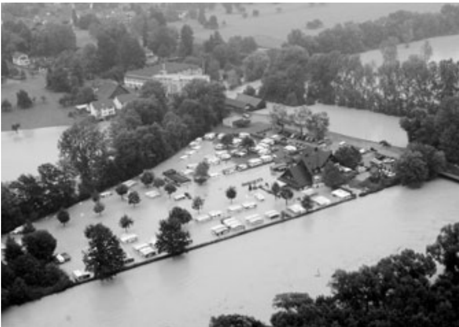
Der geeignete Umgang mit der Ressource Boden kann dazu beitragen, solche Hochwasserereignisse zu vermindern. Auch die Landwirtschaft kann durch angepasste Nutzung und schonende Bodenbearbeitung aktiv zum Hochwasserschutz beitragen. (Im Bild: Campingplatz Ottenbach, August 2005).

Diese Überlegung basiert auf einer nicht ganz realistischen Annahme eines 100-prozentigen Bodenverlustes bei baulichen Nutzungen. Da jedoch auch ausserhalb der Bauzonen erhebliche Verluste an Speichervolumen auftreten, z. B. durch den Bau von Verkehrsanlagen oder durch temporäre Nutzungen von Böden (siehe unten), dürfte die Grössenordnung stimmen.