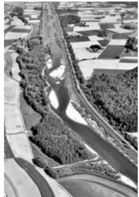
Zwischen Niederneunforn und Altikon hat die Thur bei einer Revitalisierung ausserdem mehr Platz bekommen.