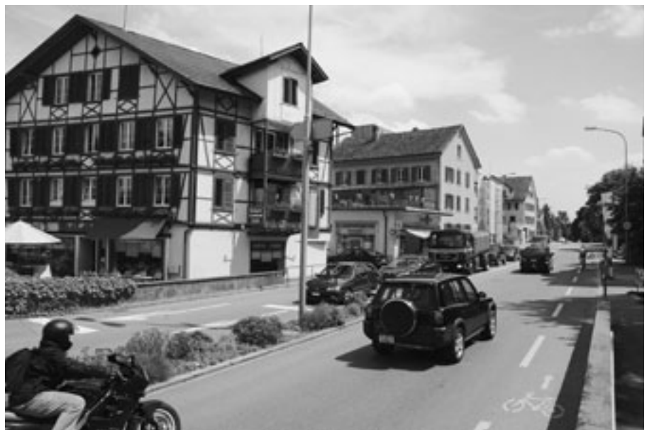
An der Fassade kommen keine modellierten Schallwellen an, sondern veritabler Strassenlärm. Messungen zeigen eine hohe Übereinstimmung des Modelles mit der Wirklichkeit (Kamerastandort: Siehe Pfeil in der Karte auf Seite 31).

Die Datenqualität der amtlichen Vermessungen wird zunehmend besser. Damit auch die Ergebnisse der Lärmberechnungen immer genauer werden können, wird der Kataster regelmässig aktualisiert. Der Lärmbelastungskataster wird so zu einem praktischen und unersetzlichen Hilfsmittel für eine erfolgreiche Planung und Umsetzung der Lärmsanierungen an den Strassen im Kanton Zürich.