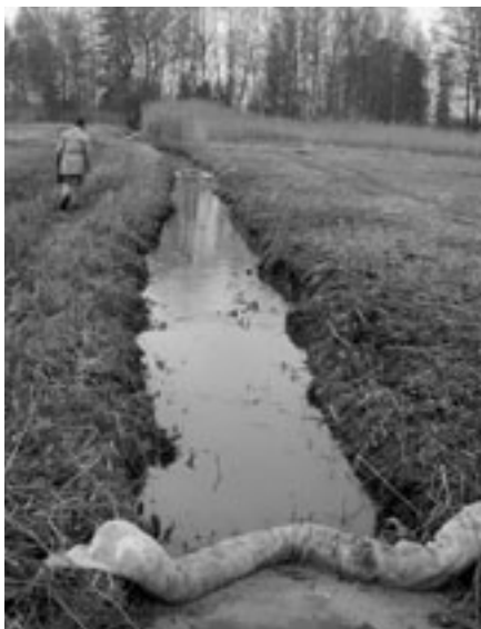
Bach mit Ölsperre.

Gerade Verunreinigungen des Trinkwassers können sich verhängnisvoll aus-